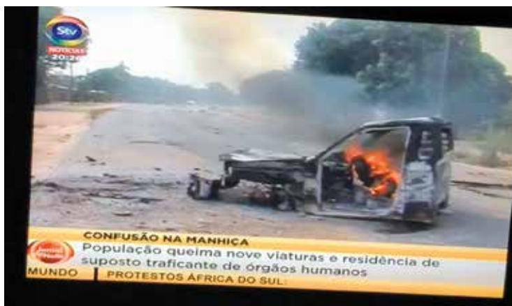
Jornal de Notícias, STV, a 30 de Abril de 2018

A população na vila da Manhiça (província de Maputo) revoltou-se, incendiando residências e viaturas, como forma de manifestar-se contra um cidadão que era acusado de ter assassinado e extraído os órgãos genitais de alguns menores. Por medo de ser linchado, o suposto traficante, alegadamente um dos maiores empreendedores locais, refugiou-se no comando da polícia, para onde se deslocaram as pessoas “exigindo a cabeça” do mesmo.