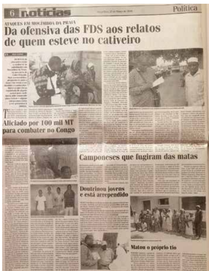
Jornal notícias, 27 de Março de 2018