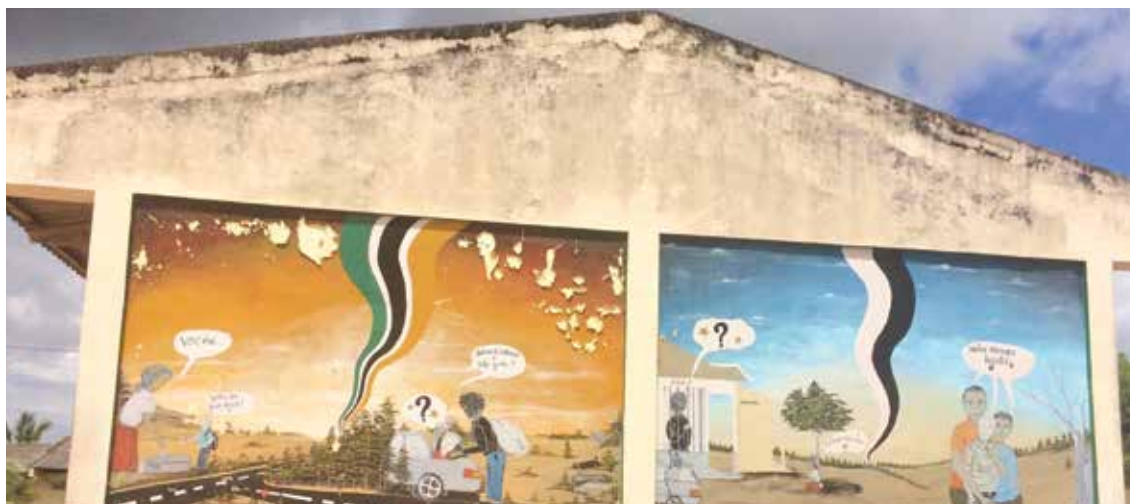
Escola Secundária (Monapo, Província de Nampula)

Numa visita a Moçambique (2016), Ikponwosa Ero, perita independente da Organização das Nações Unidas (ONU) sobre os direitos humanos das pessoas com albinismo, refere que, apesar de todos os sucessos alcançados por Moçambique na proteção das pessoas com albinismo, a situação continua precária. “As pessoas com albinismo, desde a nascença e toda a vida até a morte, são caçadas e partes dos seus corpos – que vão desde a sua cabeça até aos dedos dos pés, cabelos, unhas e até fezes - são recolhidas,” relatou. Estas práticas são levadas a cabo por indivíduos que acreditam que poções ou amuletos produzidos a partir de partes do corpo de pessoas com albinismo têm poderes mágicos, como dar sorte para o enriquecimento. “Enquanto não se encontrarem os autores morais, a questão da segurança das pessoas com albinismo vai continuar precária,” alertou a perita da ONU. Acrescentou que a precariedade da situação dos direitos humanos das pessoas com albinismo está igualmente relacionada com o envolvimento dos próprios familiares das vítimas nos crimes.