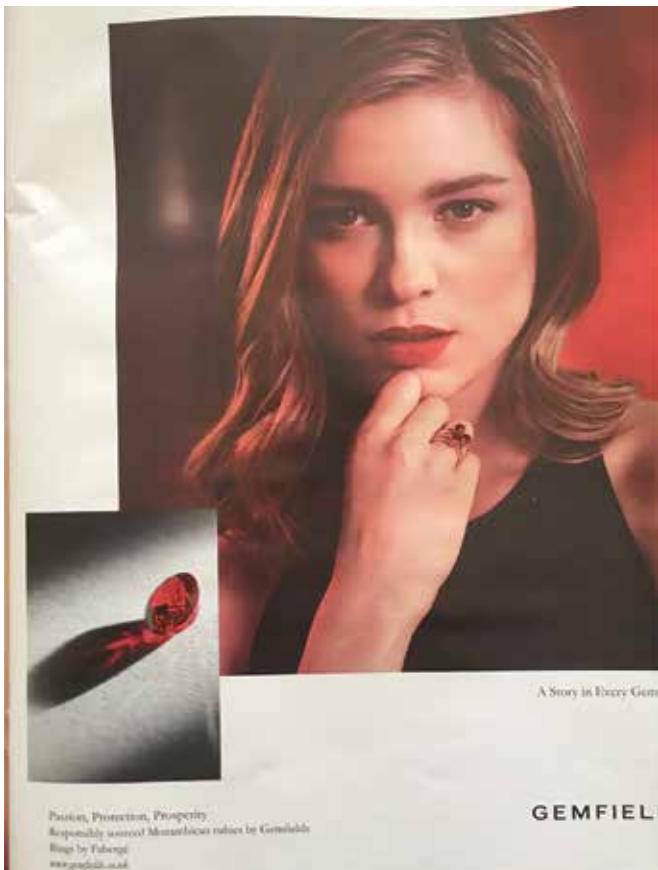
Financial Times "How to spend it", March 2018