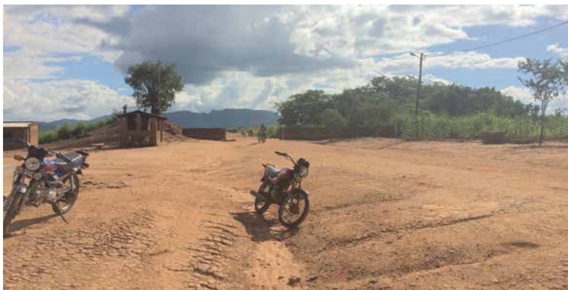
Fronteira de Mandimba na Província de Niassa

Não obstante a grandiosidade e beleza da natureza, Niassa é identificada pelos próprios habitantes como a província esquecida de Moçambique, a mais isolada e marginalizada. Em termos de infraestruturas, uma das características que sobressai no sentido negativo são as vias de acesso muito precárias. A estrada que liga as duas principais cidades da província, Lichinga e Cuamba, está de tal forma degradada que se levam cerca de 8 horas para fazer 300km, e na capital da província, Lichinga, o estado deteriorado das estradas coloca sérios problemas de mobilidade para a população.