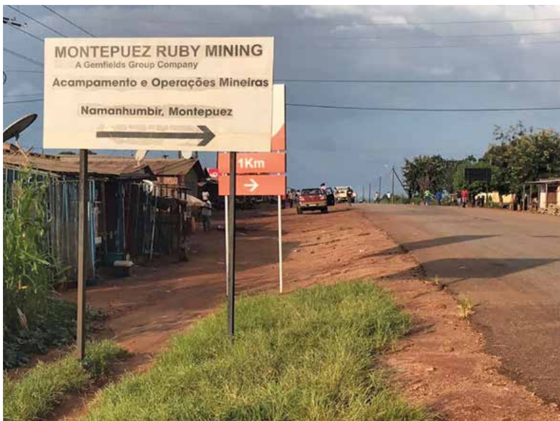
Placa sinalizadora do Grupo Gemfields (Montepuez, Março 2018)

Movimentos ilegais de pessoas, dinheiro do rubi, prostituição, exploração laboral, e assim, estão criadas as condições para o crime. Os homicídios são frequentes em Montepuez. “Era normal ouvir-se tiros de arma de fogo até durante o dia”, referiu um informante da justiça. “Ali na cidade você só está a ouvir gritos, depois pára”, expôs uma informante.