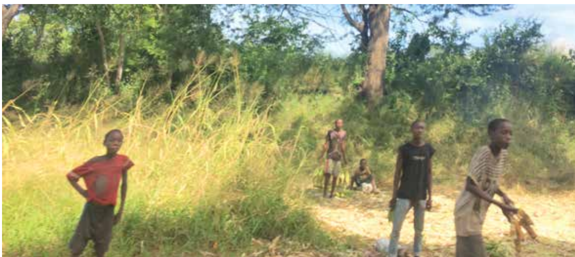
Crianças a vender maçaroca na berma da estrada (Pemba, Província de Cabo Delgado)

Versa-se mais sobre mulheres e crianças, mas claramente os homens também são vítimas. Homens jovens são mais comumente identificados na modalidade de trabalho forçado. Como já foi referido, o tráfico de pessoas confunde-se com os fluxos migratórios irregulares e contrabando de migrantes, sendo difícil distinguir as vítimas de tráfico entre estes fluxos. A grande maioria dos migrantes irregulares identificados no país eram homens. Relativamente ao tráfico de partes do corpo humano tem sido registado que, em alguns contextos, a extração de órgãos humanos não tem finalidades cirúrgicas, mas se destina à prática de “rituais de feitiçaria ou magia”. Nas últimas décadas, relatos de roubo de genitais têm sido frequentes em vários países do continente Africano, incluindo Moçambique. Os órgãos genitais masculinos são os mais procurados, aparentemente vendidos aos médicos tradicionais para uso no tratamento da impotência sexual masculina e para cerimónias.