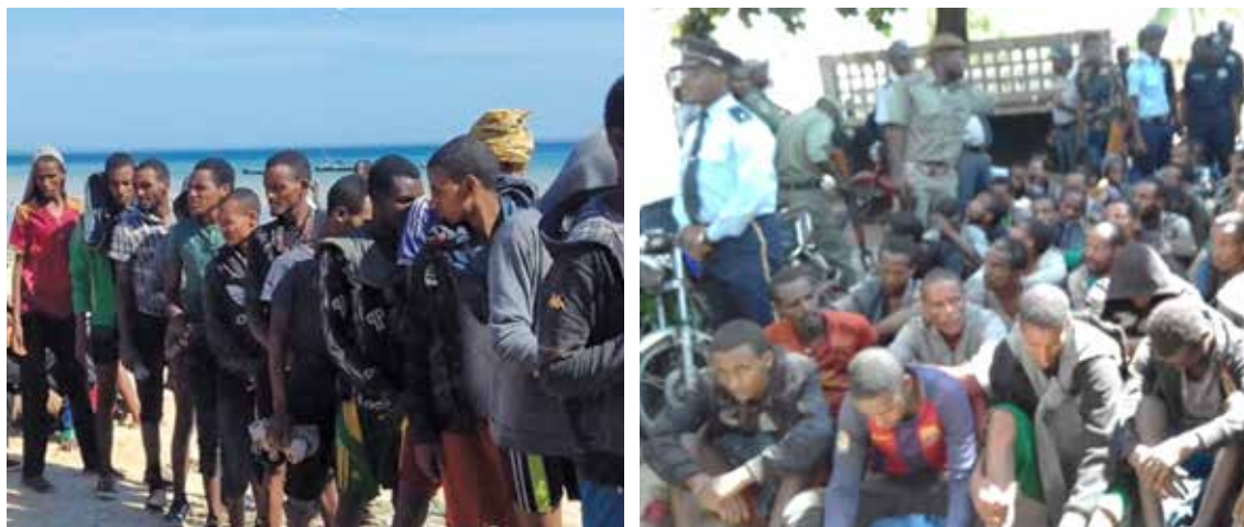
Fotografias cedidas por uma informante (Pemba, Abril 2018)

Os casos mais registados dizem respeito a cidadãos etíopes e somalianos, que entram por Cabo Delgado, geralmente em trânsito para a África do Sul, mas há também registo de contrabando de migrantes do Bangladesh e do Paquistão, entre outras nacionalidades.